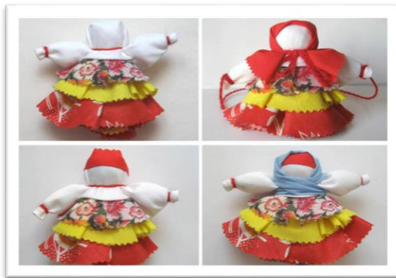
КУКЛЫ «ДЕНЬ» И «НОЧЬ»

Два одинаковых по размерам квадрата ткани синего и белого цветов, ветошь, синие и белые нитки